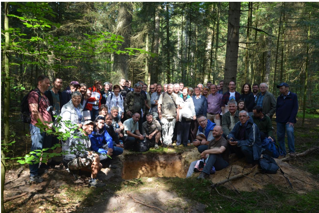
Lauko ekspedicijos dalyviai Rostočės nacionaliniame parke ( Roztoczański Park Narodowy ) po miško smėlžemio profilio apžiūros.

Neatsiejama kongreso dalimi tapo ir tradicinės pažintinės lauko ekspedicijos, kurios šiais metais vyko net trimis skirtingais maršrutais (žr. lauko ekspedicijos vadovą , patalpintą LDD interneto svetainėje ). Renginio dalyviams buvo sudaryta puiki galimybė detaliau susipažinti su dirvožemio erozijos padariniais Rogalów vietovėje, pagilinti žinias apie Liublino aukštumos geologinę sąrangą bei apžiūrėti unikalius glaukonitinio molio profilius. Pokonferencinėse dviejų dienų išvykose (2-asis ir 3-iasis maršrutai), kurios buvo pasiūlytos tik papildomai užsiregistravusiems dalyviams, buvo galimybė apsilankyti Polesės ir Rostočės ( Roztoczański ) nacionaliniuose parkuose bei pažangiame ūkyje, įsikūrusiame Rogów vietovėje ir garsėjančiame savo inovacijomis taikant beariminę žemdirbystę bei atsakingu požiūriu į dirvožemio kokybės išsaugojimo klausimus.