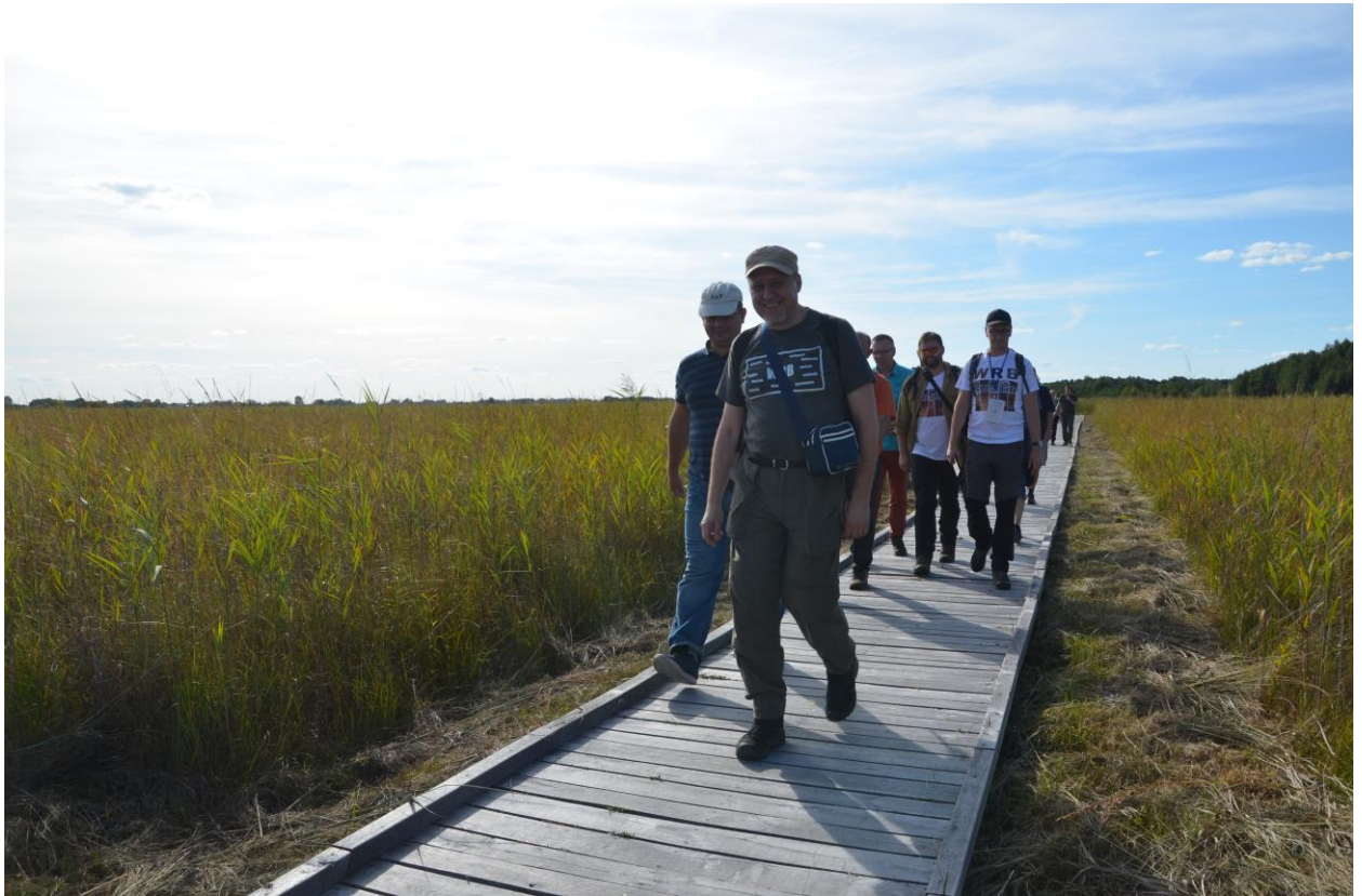
Žengiant pažintiniu Bubnów pelkės taku (Poleski Park Narodowy).

Iš kongreso grįžome puikios nuotaikos – parsivežėme daug gerų įspūdžių, naujų patirčių ir idėjų. Džiugu, jog dar 2001 m. gruodžio 12 d. pasirašyta mūsų draugijų dvišalio bendradarbiavimo sutartis yra gyvybinga. Eilinį kartą įsitikinome, kaip svarbu palaikyti tamprų ryšį su kolegomis, dalyvauti jų organizuojamuose reprezentaciniuose renginiuose, gyvai domėtis ir žinoti kuo gyvena ir kokias veiklas jie vysto. O pamatyti ir pasimokyti iš Lenkijos dirvožemininkų tikrai galima. Šiuo metu kaimyninės valstybės dirvožemininkų draugija išgyvena savotišką sėkmės istoriją – ji yra stipri moksliniu požiūriu ir gerai žinoma tarptautinėje erdvėje, ji yra pajėgi ir perspektyvi organizacine prasme – ji sėkmingai atsinaujina, į savo gretas nuolat pritraukdama entuziastingų „vakarykščių doktorantų“.